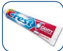
La pasta dental