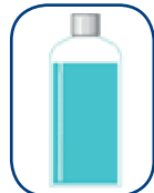
Ciertos enjuagues bucales