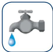
El agua corriente